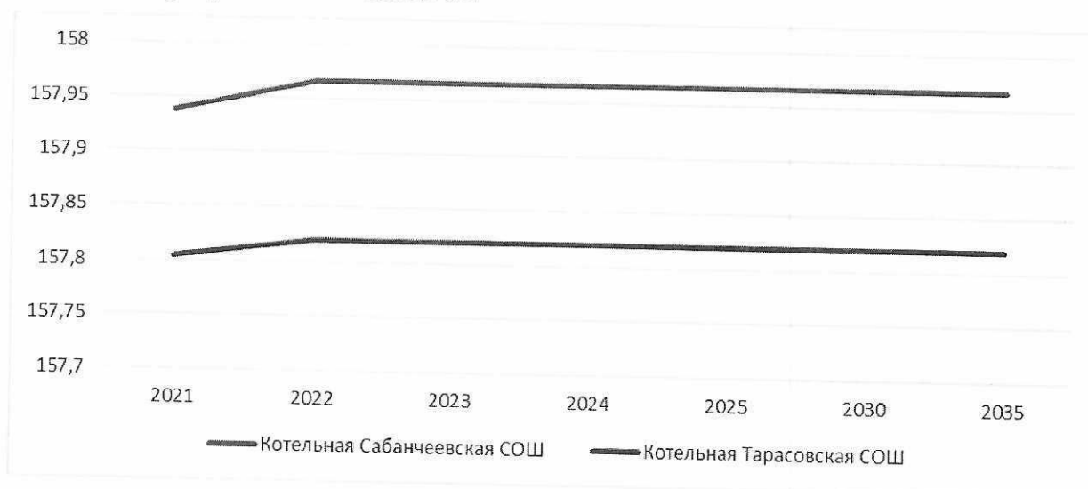
Рисунок 1. Динамика НУР топлива на период 2021-2035 г.г

Прогнозы по отпускаемой тепловой энергии и топливопотреблению рассматривались по котельным, которые задействованы в схеме теплоснабжения, со следующим допущением: производство тепловой энергии ведомственной котельной остаётся на уровне базового года. Перспективное значение удельных расходов топлива на производство тепловой энергии приведено на рисунке 1 и в таблице 11.